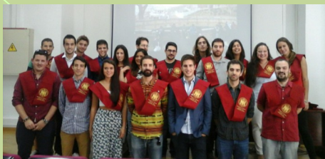
Egresados 4ª edición